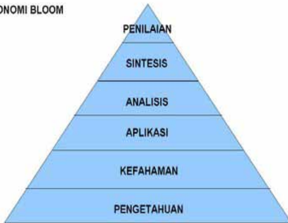
Rajah 1 Model Taksonomi Bloom 1956.