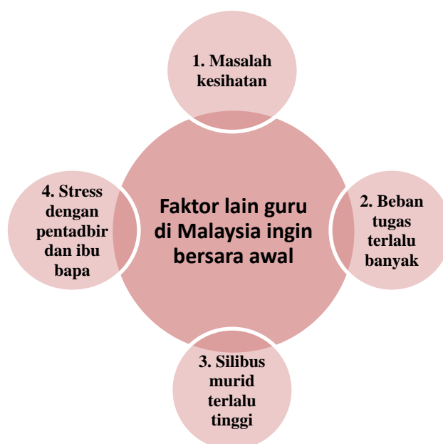
RAJAH 2: Faktor-faktor lain GBM merancang bersara awal