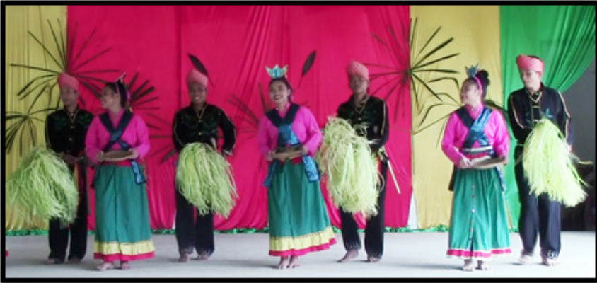
Sumber: Koleksi pengkaji (15 April 2016)

Foto 11 Penari lelaki dan perempuan dalam posisi seranting selepas jeritan kedengaran ketiga dilakukan.