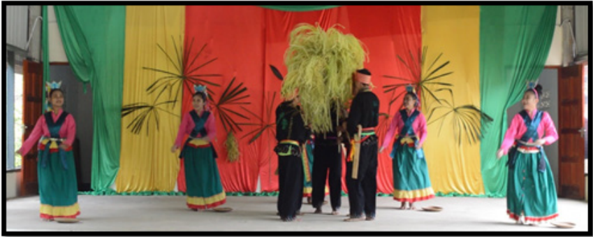
Sumber: Koleksi pengkaji (15 April 2016)

Foto 8 Penari perempuan pula meletak libu di atas lantai dan mula menghayun kedua-dua tangan mereka ke arah atas.