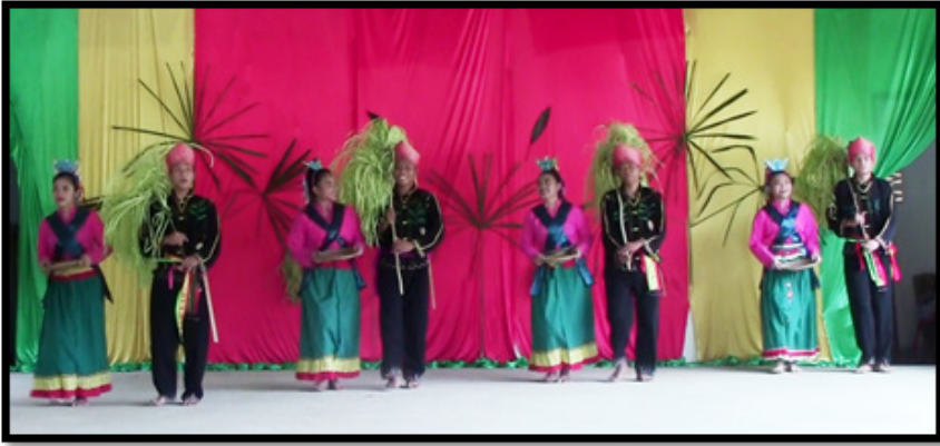
Sumber: Koleksi pengkaji (15 April 2016)

Foto 11 Penari lelaki dan perempuan dalam posisi seranting selepas jeritan kedengaran ketiga dilakukan.