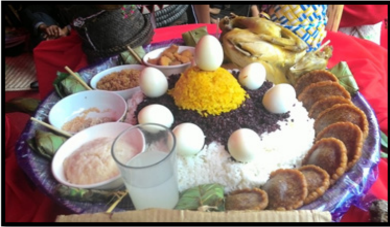
Sumber: Koleksi pengkaji (31 Mei 2016)

Foto 7 Sajian pemujaan semangat yang dihidang di dalam libu (nyiru).