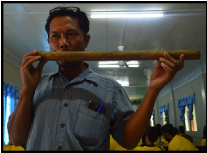
Sumber: Koleksi pengkaji (9 November 2018)

Dalam upacara monginsamung , persembahan tarian Sumanggak dimulakan dengan rombongan upacara pengebumian si mati yang kembali dan menghampiri rumah si mati akan meniup toburi (alat muzik tiup yang diperbuat daripada buluh - Foto 1) terlebih dahulu. Sebaik sahaja bunyi tiupan toburi kedengaran, bolian mula menaburkan beras dalam nyiru di sekeliling halaman rumah sambil melafazkan rinait (puisi upacara). Dalam upacara ini, ketua kampung yang memegang daun silad akan mengikuti bolian mengengjut-enjut sambil bergerak ke hadapan dalam bentuk bulatan di halaman rumah si mati. Pergerakan sedemikian dianggap sebagai menarikan tarian Sumanggak. Apabila rinait selesai dilafazkan oleh bolian , beliau akan monotas silad (memotong daun silad) yang dipegang di bahu ketua kampung. Kemudian, daun silad yang dipotong dan jatuh ke lantai itu akan digantung di depan pintu rumah si mati. Perbuatan ini menandakan ahli keluarga di rumah tersebut baharu sahaja meninggal dunia.