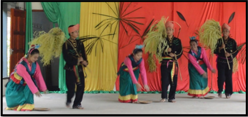
Sumber: Koleksi pengkaji (15 April 2016)

Foto 8 Penari perempuan pula meletak libu di atas lantai dan mula menghayun kedua-dua tangan mereka ke arah atas.