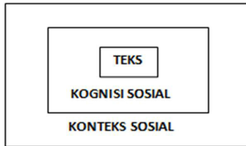
Rajah 1: Model Analisis Wacana Van Dijk

Pendekatan yang digunakan dalam kajian ini ialah pendekatan wacana teks yang menggunakan kaedah secara kualitatif. Kajian ini merupakan kajian analisis wacana peribahasa berdasarkan teks, pemikiran serta konteks sosial dalam masyarakat. Kajian ini akan berfokus kepada model „social cognitive“ model Van Dijk (1999) yang menggambarkan wacana teks sebagai memiliki tiga dimensi, iaitu teks, kognisi sosial, dan konteks sosial.