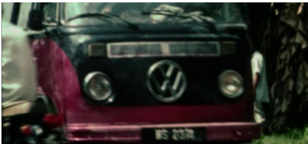
Motor terpaksa ke tepi untuk beri laluan kepada van tersebut