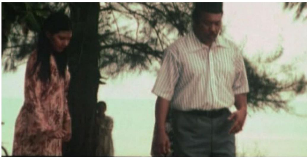
Pendidikan informal dan melalui pemerhatian sedang berlangsung

“Zapin ni hiburan orang kampung, mereka menari sebelah malamnya setelah solat isyak sampai ke pagi”