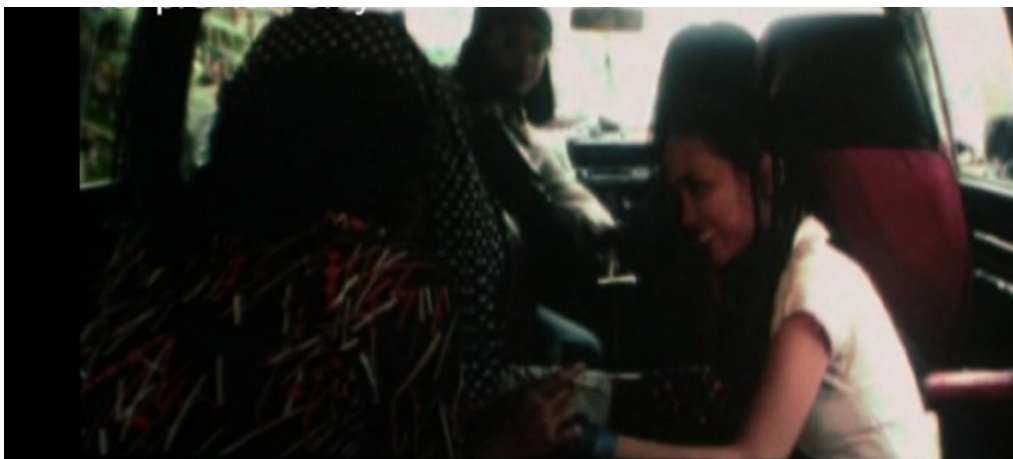
Remaja Hippies dalam van tersebut

Bingkai di bawah pula menunjukkan posisi Zaleha yang sedang menaiki basikal serta sebuah van sedang juga menuju ke arahnya dan diakhiri dengan kemasukan bunyi seakan berlaku pelanggaran. Dari segi semiotiknya, proses perjalanan darah boleh tergugat jika terdapat unsur asing yang masuk ke dalam saluran darah tersebut. Jalan utama menjadi tanda tempat saluran darah yang bertindak sebagai nadi budaya masyarakat kampung, rutin harian sekitar nadi ini dipaparkan seakan terhenti dan tersentak dengan kedatangan virus-virus asing (props semiotiknya van). Pertembungan budaya tersebut mencabar budaya 'dominan' bahawa tarian zapin ini sepatutnya berpotensi lebih luar biasa untuk meneruskan kelangsungan fungsi sosial dan budayanya dengan tenang tanpa ada pengaruh asing yang mengancam budaya warisan.