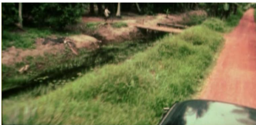
Babak menunjukkan pertembungan antara Zaleha dan Van tersebut akan terjadi

Bingkai di bawah pula menunjukkan posisi Zaleha yang sedang menaiki basikal serta sebuah van sedang juga menuju ke arahnya dan diakhiri dengan kemasukan bunyi seakan berlaku pelanggaran. Dari segi semiotiknya, proses perjalanan darah boleh tergugat jika terdapat unsur asing yang masuk ke dalam saluran darah tersebut. Jalan utama menjadi tanda tempat saluran darah yang bertindak sebagai nadi budaya masyarakat kampung, rutin harian sekitar nadi ini dipaparkan seakan terhenti dan tersentak dengan kedatangan virus-virus asing (props semiotiknya van). Pertembungan budaya tersebut mencabar budaya 'dominan' bahawa tarian zapin ini sepatutnya berpotensi lebih luar biasa untuk meneruskan kelangsungan fungsi sosial dan budayanya dengan tenang tanpa ada pengaruh asing yang mengancam budaya warisan.